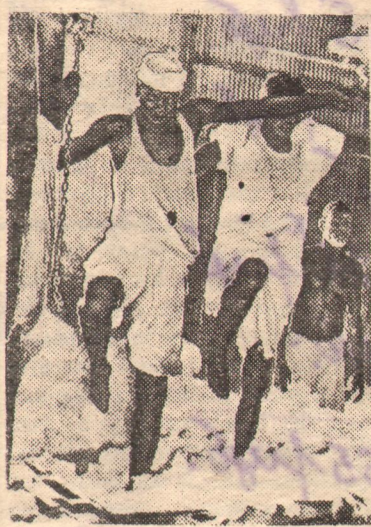
Судан. В цехе хлопкоочистительной фабрики в Меренгане.

КАИРО. (ТАСС). Агентство Франс Пресс, ссылаясь на египетскую газету «Аль-Ахрам», сообщило о предстоящем съезде в Хартуме представителей полити-